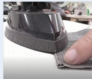
アイロンの基本操作、 アタリが出やすい素材に対するテクニック